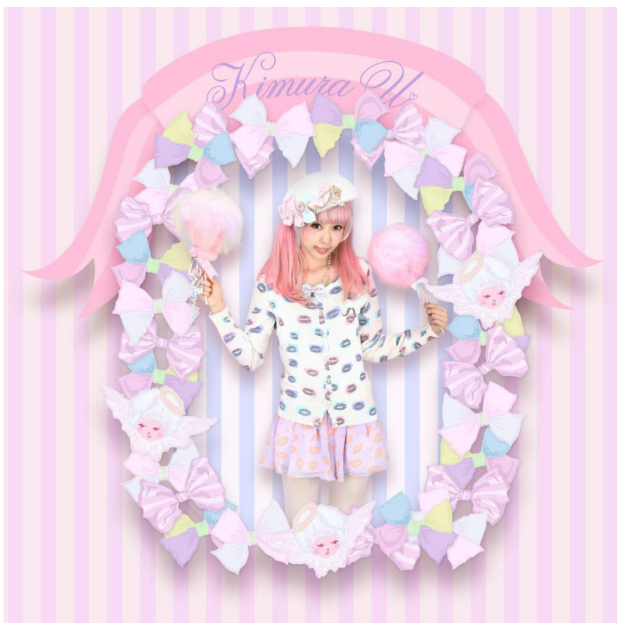
Un pull original présenté par Kimura U